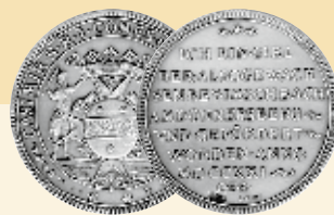
Silbertaler aus Imsbach aus dem Jahre 1721

Bergbauspuren aus den letzten 600 Jahren begegnen dem Besucher bei einem Rundgang durch das ausgedehnte Stollensystem des Besucherbergwerks „Weiße Grube“: Von sauber mit Schlägel und Eisen bearbeiteten Bereichen aus dem Mittelalter bis hin zu den mit Sprengstoff herausgeschossenen Grubenbauen der letzten Bergbauphase zu Beginn des 20. Jahrhunderts. Kupfer-, Silber- und Kobalterz wurde hier in mühsamer Arbeit ans Tageslicht gebracht. In den großen unter- und übertägigen Abbauweitungen lassen in allen Farben leuchtende Minerale den einstigen Erzeichtum der Grube erahnen. Übertage werden Techniken zur Aufbereitung der Erze gezeigt.