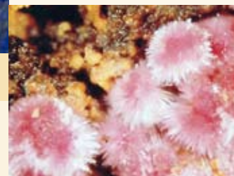
Kobalterz aus Imsbach