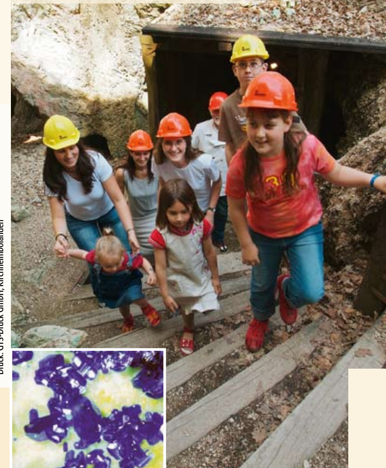
Druck: GTS-Druck GmbH, Kirchheimbolanden