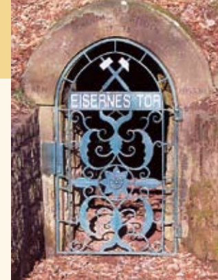
„Eisernes Tor“ - Wahrzeichen des Eisenerzbergbaus

Seit 2006 ist die über 250 Jahre alte und letztmals 1923 betriebene Eisenerzgrube zu begehbar. Die Besichtigung ihrer Stollen und Schächte bietet ein eindrucksvolles Bild von der harten Arbeit unter Tage. Die Grube besitzt zwei Ebenen (bergmännisch = „Sohlen“). Der Hauptstollen der unteren Sohle ist etwa 250 Meter lang und dabei völlig gerade, so dass man von seinem hinteren Ende aus noch den Eingang als kleinen hellen Punkt erkennen kann. Hier und in mehreren Seitenstollen erfährt man viel über die erschlossenen Gesteine, die Eisenerzvorkommen und Bergbautechniken. Über einen Schacht mit Wendeltreppe gelangt man zum rund 15 Meter höher liegenden Stollen der oberen Sohle, der in seinem Verlauf enge Stollen aus dem 18. Jahrhundert quert. Nach knapp 100 m wird auf der anderen Seite des Berges wieder das Tageslicht erreicht.