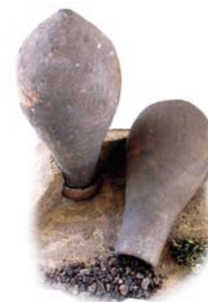
historische Retorten zur Quecksilbergewinnung